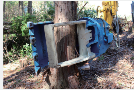
ハイブリッドバケット / OHB-60