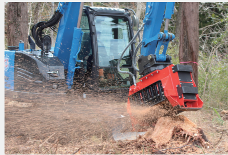
切株グラインダー / OSP-60