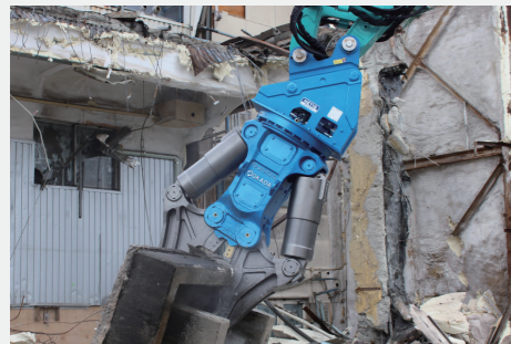
油圧オートクラブ / ALSQ400