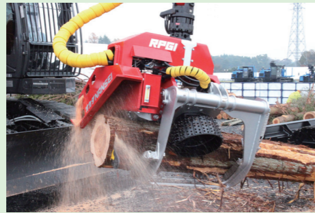
ローラ式プロセッサ / RPG1 (仮称)