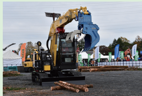
ハイブリッドバケット / OHB-60