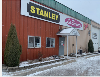
CHICAGO 市郊外にあるオフィス