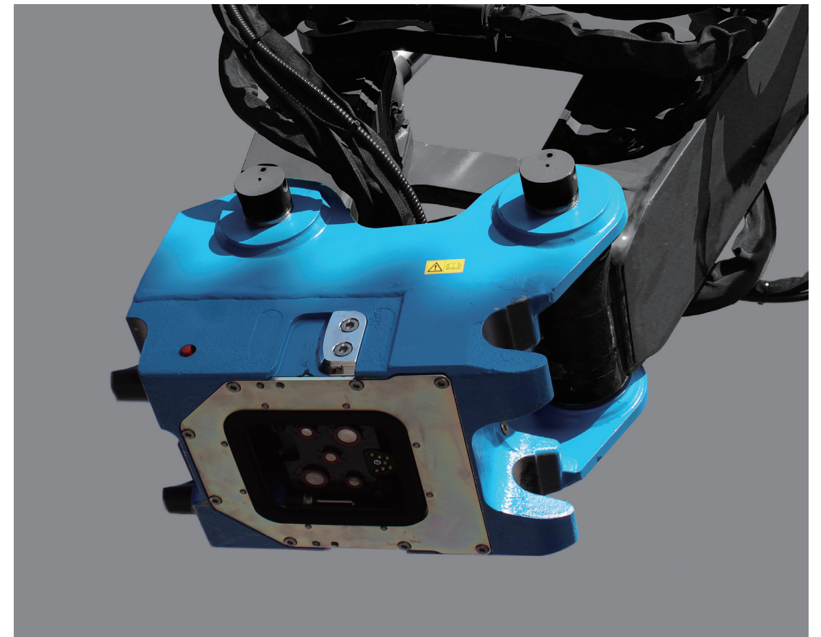
油圧オートカプラ ALSQ120

オカダ NANSEI(南星機械)のマスコットキャラ「オカダニャンセイ」が誕生いたしました。誕生日は2/13。なんと偶然にも南星機械設立と同じ日です！[オカダライオンのように社名の韻を踏んだ名前を考えていた時、ふと頭に降りてきたのが「ニャンセイ」でした。] ライオンと同じネコ科のネコをベースに、耳は木材用グラップルの爪、しっぽには南星の「星」があしらってあります。この先様々な場面で登場予定です。可愛がっていただけますと幸いです。《 南星機械・広岡 》