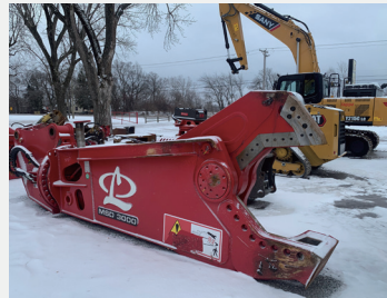
スクラップシャー