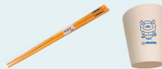
【数量限定】 国産ひのき箸 / バンブータンブラー

ワクワクチームとして最新技術が機械に活かさないかという目的をもってCSPI-EXPO2022を見学して参りました。驚いたのはデジタル機器の進歩です。3Dモデルで浚渫の施工管理を行うことで現場進捗がリアルタイムで管理できるシステム(写真1)がありました。またショベルの遠隔操作は純正のシステムからベンチャー、レンタルと様々に展開され(写真2)、危険な現場から人を守ろうとする雰囲気が高まっています。ショベルのバケット刃先位置を無線センサーで見える化するシステム(写真3)もあり、初心者でも熟練者と同じ施工結果が出せるようにしていました。土木のショベルの情報化施工はやがて林業、解体へと広がってくと感じています。技術に後れを取らないように感度を高くし、対応力も高めていきたいと気持ちを新たにいたしました。《ワクワクチーム・佐野》