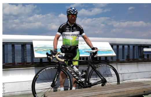
今年の春、琵琶湖一周をした時の記念フォト