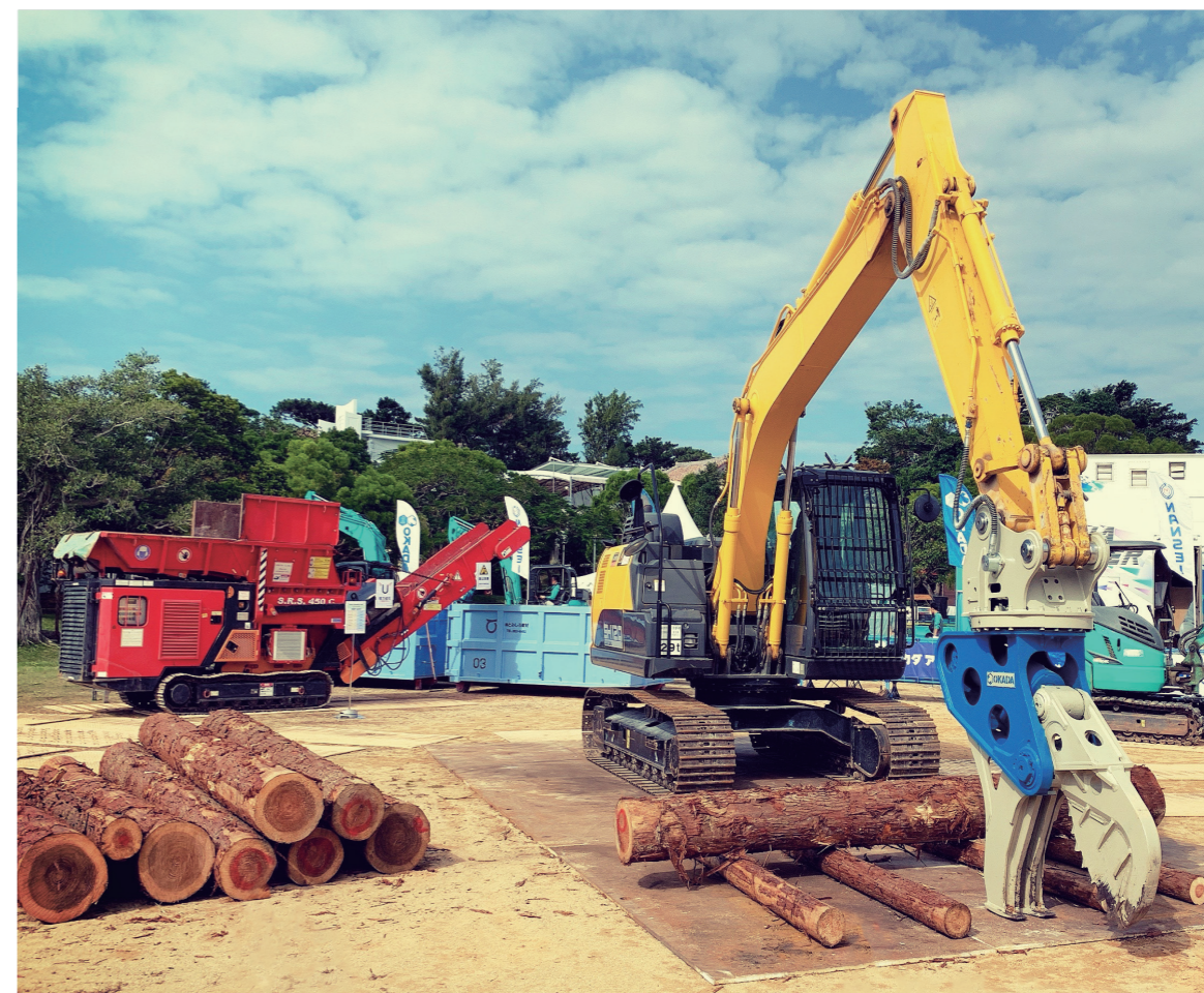
2019 林業展・沖縄県宮奥武山公園