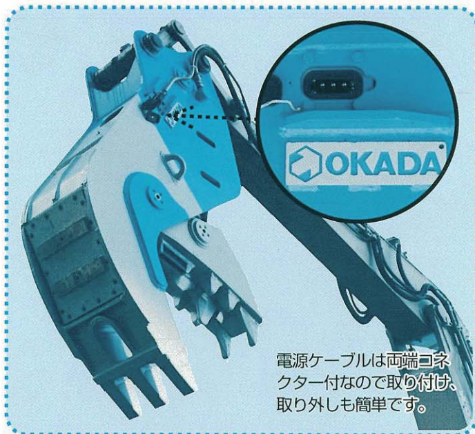
電源ケーブルは両端コネクター付なので取り付け、取り外しも簡単です。

ベースマシンは破碎能力、耐久性に定評のあるサイレントコワリクン。開閉スピードも早く、小割作業もスピーディです。外観もスマートでコワリクン従来の機能を充分生かし、さらに便利な機械としてご使用いただけます。