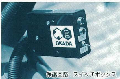
保護回路 スイッチボックス

また、保護回路 (スイッチボックス) を設け、スイッチの切り忘れなどによるバッテリーの消耗や、機器類の損傷を防ぎます。