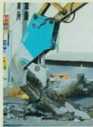
OSC-25RV OSC-50RV OSC-80RV