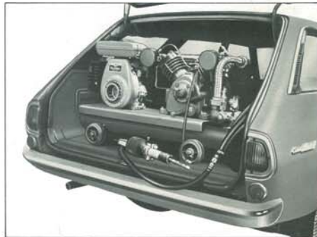
ライトバンに積み込める手軽さ!!