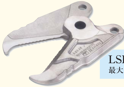
LSI 230 最大開口幅225mm