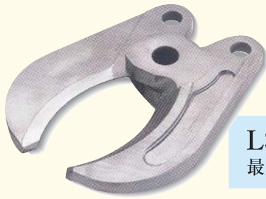
LSI 220 最大開口幅154mm