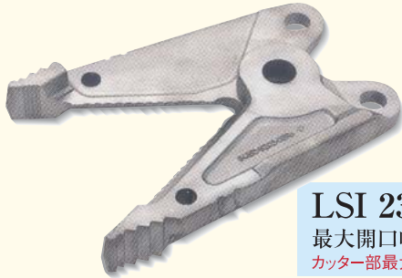
LSI 235 最大開口幅360mm カッター部最大開口幅265mm