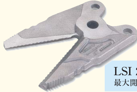
LSI 240 最大開口幅285mm