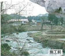
施工前 ■施工例 1

力強いつかみ力と優れた作業性で、 確かな工事と工期の短縮を実現。 巨石・自然石を つかむのに理想的な 1本・2本爪 特許取得済