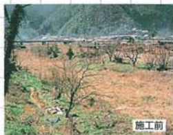
施工前 ■施工例 2