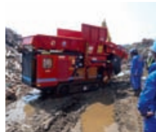
写真：気仙沼にて活躍中のビッグバス