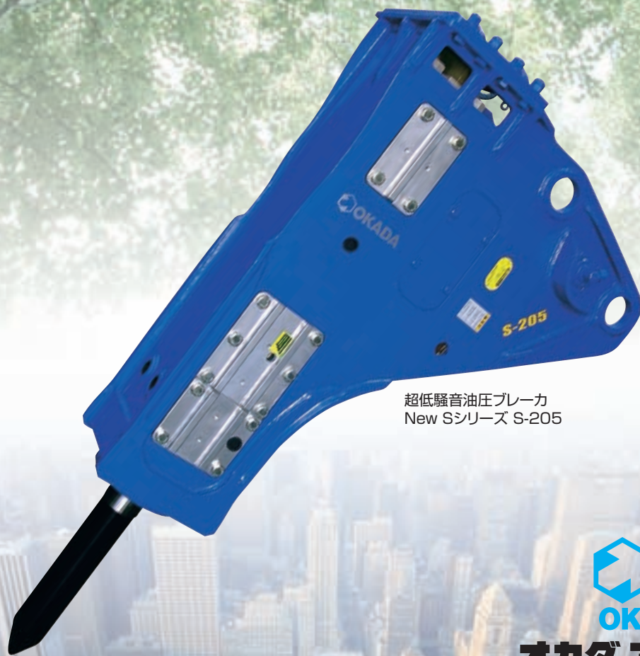
超低騒音油圧ブレーカ New Sシリーズ S-205