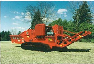
Model 3600 Track