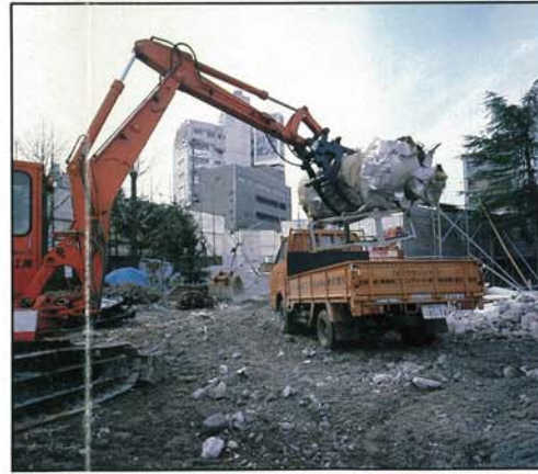
ミニバックホー解体積込作業