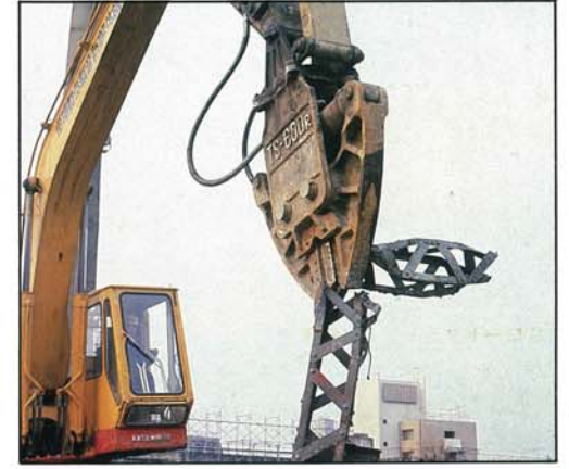
中・軽量鉄骨切断機