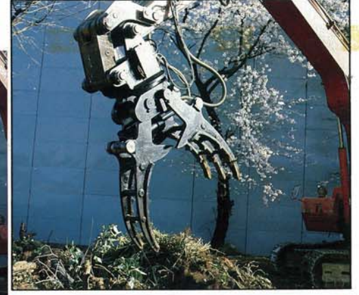
自動回転装置付は自由な角度で作業が出来ま す。