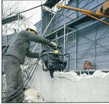
吊り具により“カベ”の解体 (左) 電動油圧ユニット、又はエンジン付いずれも 使用出来ます。