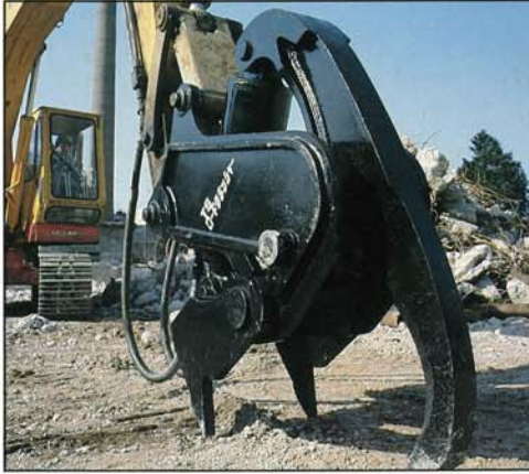
道路破碎機として開発!!