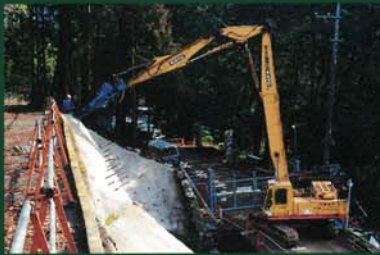
超ロングショベルで高所へ打設