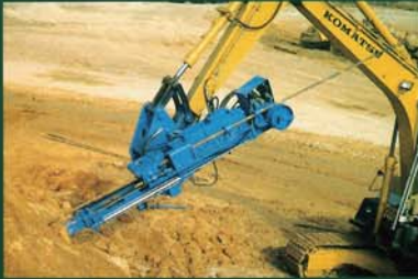
切り土法面の正面から打設