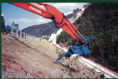
0.7m 3 ショベルに取付可能