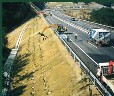
供用中の道路でも工事が可能