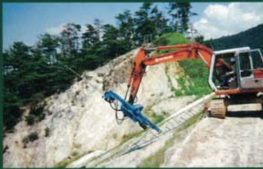
のりかた 法肩から下方へ打設