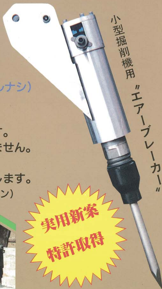
小型掘削機用 “エアブレイカー”