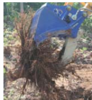
▲ダム造成や林道工事での 抜根作業