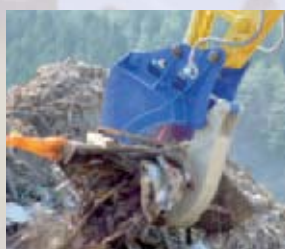
▲フォークならではの大口徑

つかみ作業に適した大きな開口とふところの広い形状で、一度に大容量のつかみ作業が可能です。